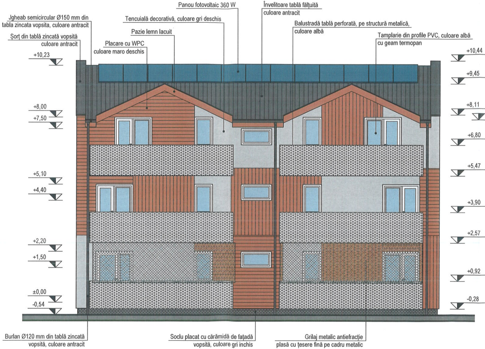
FATADA POSTERIOARA (EST)